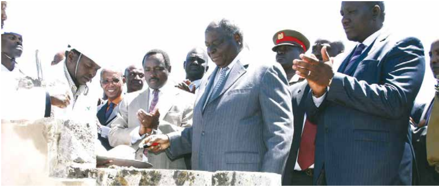
[ H.E. President Mwai Kibaki lays the corner stone of the foundation to officially launch the building and construction work of the Konza Technology City. Konza City Photos Courtesy: Presidential Press Service-PPS