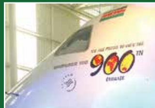
KQ acquires 12th Embraer Plane