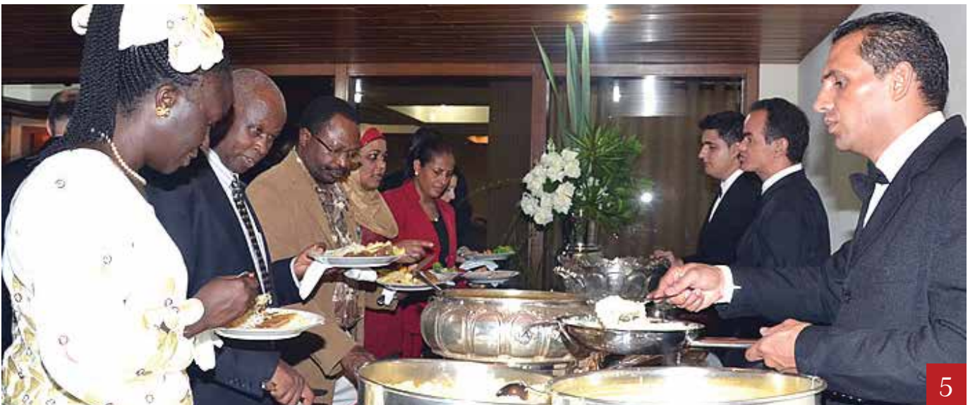
1 & 2. Guests follow the proceedings of the 49th Kenya National Day celebrations at the Official Residence of Kenya Embassy.