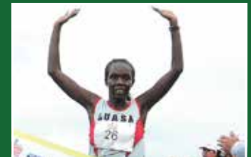
Kenyans Dominate Brazil Marathons