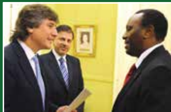
Amb. Kirimi Presents Credentials in Argentina