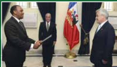
Amb. Kirimi Presents Credentials in Chile